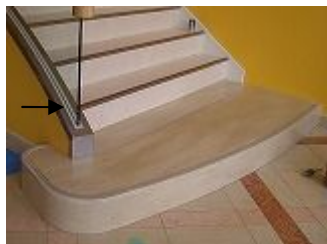
Kグリップ施工完了