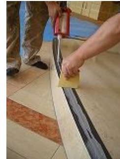
専用ゴムベラで平らにする