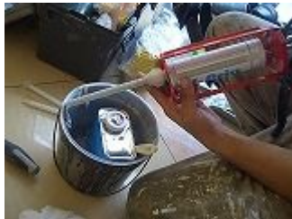
最初の約30cm分は捨てます