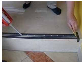
Kグリップ施工開始