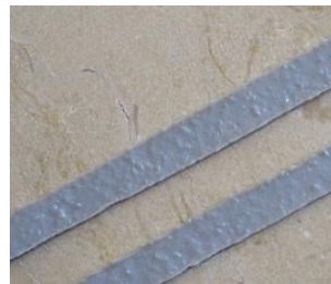
Kグリップ施工面(アップ)

Kグリップ・・・ワンポイント 夏季は2～3時間、冬季は5～6 時間で乾燥します。ヒートガンを 使用すれば早く乾燥させることが 可能です。