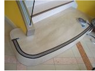
Kテープの施工完了