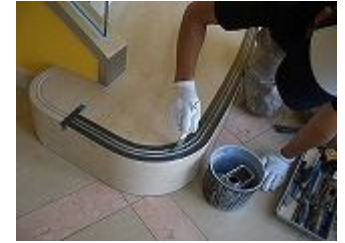
シーラント(プライマー)塗布